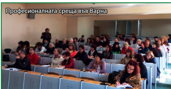
Професионалната среща във Варна

Представени бяха практически схеми на лечение, които превърнаха професионалните срещи в своеобразни работни ателиета за обмяна на опит.