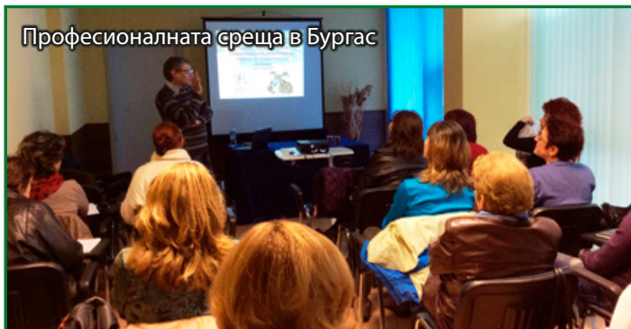
Професионалната среща в Бургас