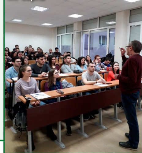
Студентски курс, МУ Варна