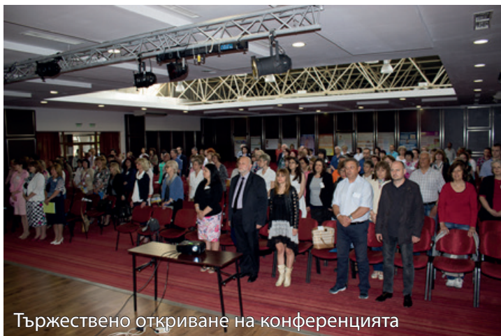
Тържествено откриване на конференцията