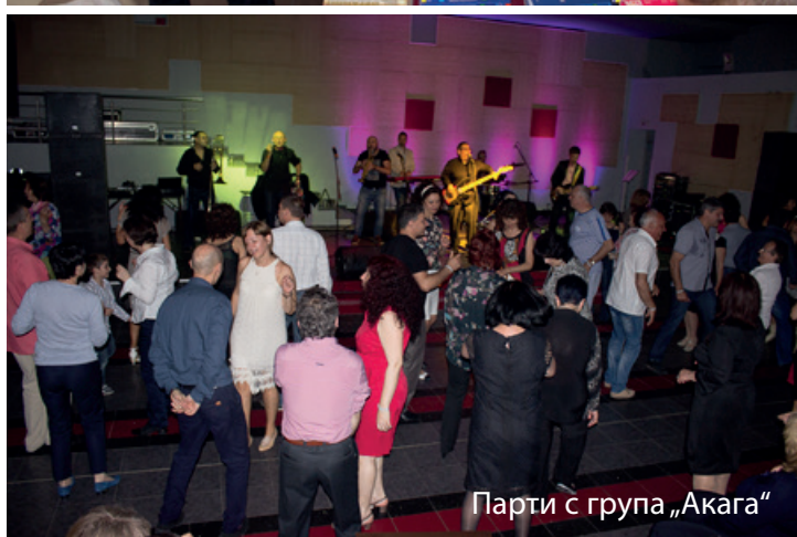
Парти с група „Акара“